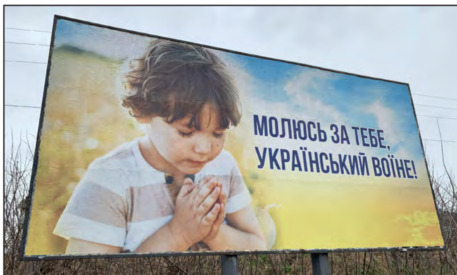
L'Ukraine, dans les pensées et les prières.

Plusieurs émissions que nous avons produites pour la RTS racontent la complexité de cette terre entre l'Est et l'Ouest, aux relations fluctuantes avec le voisin russe, chargée d'une histoire dans laquelle catholicismes et orthodoxes (le pluriel est assumé) se