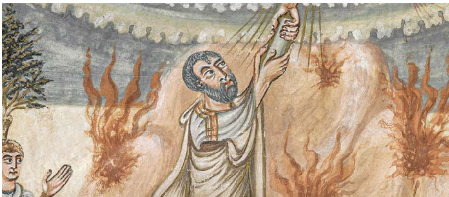
La Bible de Moutier-Grandval, réalisée au 9 e siècle dans la région de Tours, en France. L'image représente Moïse recevant les Tables de la Loi.

Serait-ce l'effet d'une actualité pétrie de changements violents et rapides ? Mais nous sommes nombreux à avoir besoin plus que jamais de contemplation et de beauté. La venue en Suisse de la Bible de Moutier Grandval et son séjour dans le Musée jurassien jusqu'en juin offrent une occasion d'en faire le plein.