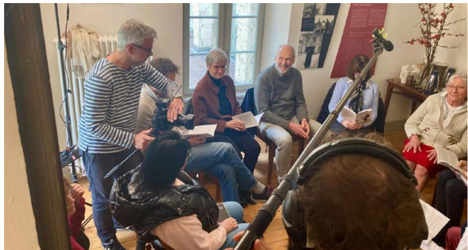
Rencontre du nouveau groupe des zundéliens de Bex à l'occasion du tournage du film d'introduction de la messe de Pâques.

La messe sera présidée par l'abbé Rolf Zumthurm, curé du secteur d'Aigle, l'homélie sera proposée par l'abbé Marc Donzé, spécialiste de