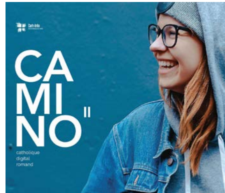
Une nouvelle série de vidéos « Camino ».

Une nouvelle saison du projet Camino est en cours de réalisation. Au programme: huit portraits vidéo et trois investigations digitales à découvrir tout au long de l'année.