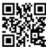
Le reportage de Vespérales en 1981.